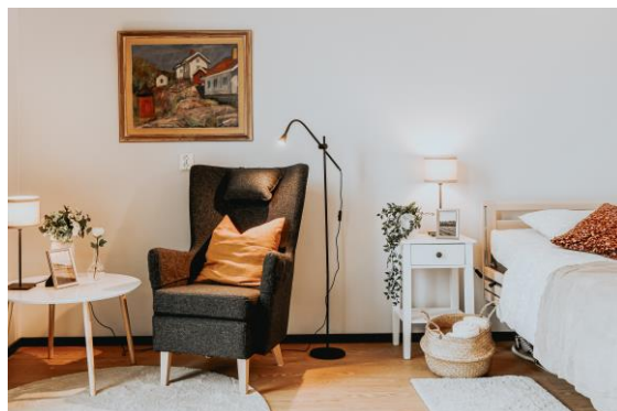
Läshörna och säng med nattduksbord