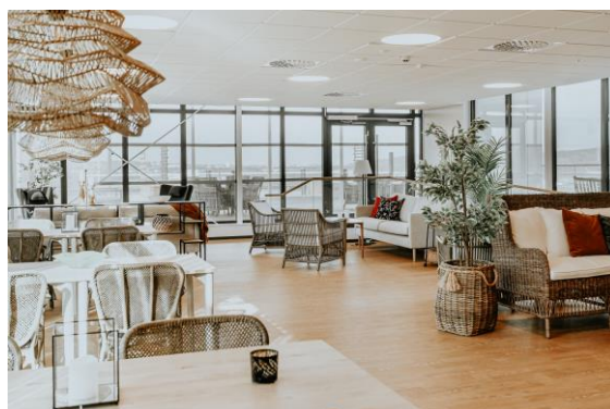
Vinterträdgård – Perfekt för konserter, pubkvällar, odlingskurser, bullbakning eller födelsedagsfirande med nära och kära.