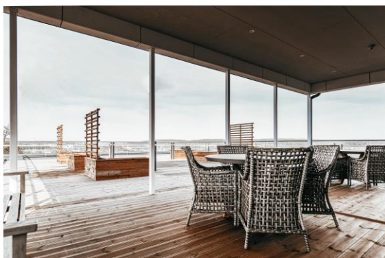
Takterrass med spaljéer, odlingslådor och fantastisk utsikt