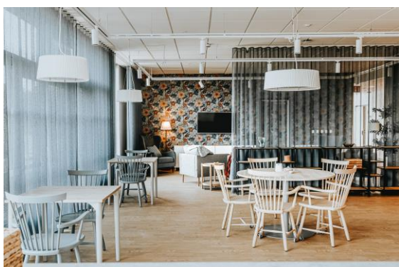
Matsal och vardagsrum som delas av 10 personer

Sociala utrymmen som finns på varje våning