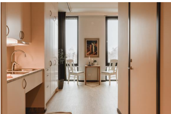
Kokvrå och matbord i visningslägenheten